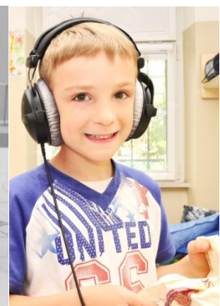
Ricreatorio Comunale “Gentilli”